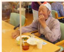
お昼ごはんは手作りの屋台メニューです