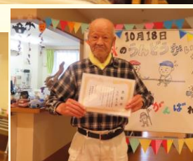
表彰式もありました!