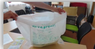
停電・断水時の食事準備と非常用トイレの使用訓練