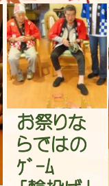
お祭りならではのゲーム「輪投げ」