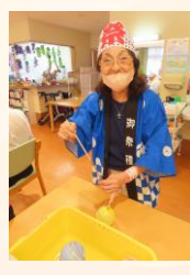
ヨーヨー釣りは「懐かしいなあ」と人気でした