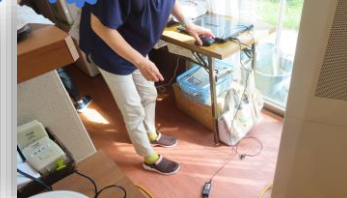
停電に備えて非常用発電機の使用訓練